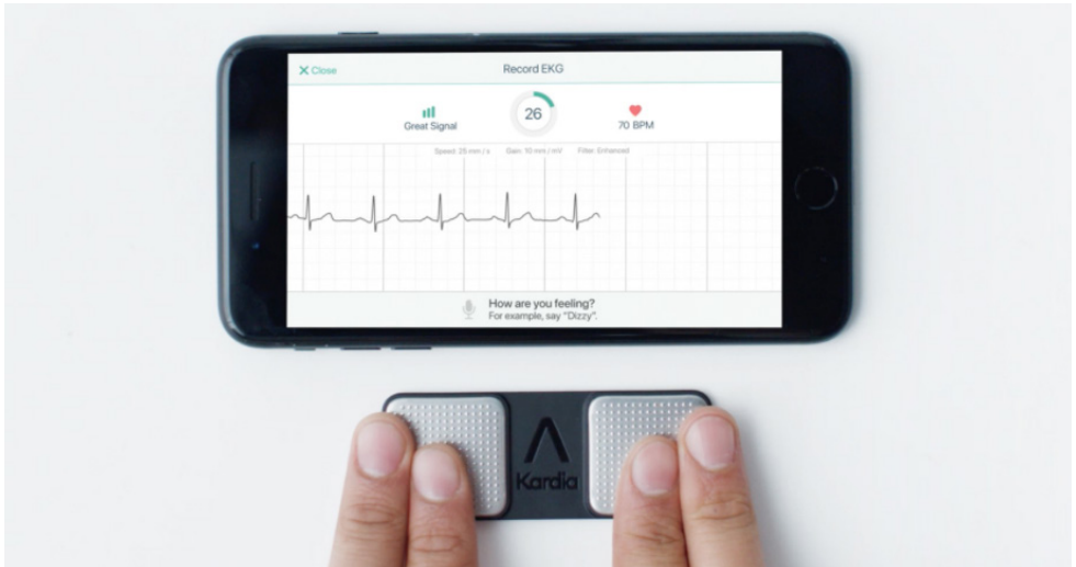
afbeelding 1: Leg uw linker wijs- en middelvinger op de linker elektrode en uw rechter wijs- en middelvinger op de rechter elektrode

Als u het hartfilmpje heeft gemaakt, geeft de Kardia Mobile app een automatische diagnose. Er zijn drie mogelijkheden: